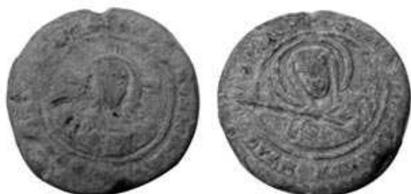
Обр. 1. Новооткрит печат на княз Борис I Михаил от Силистра