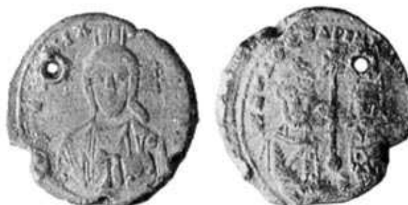
Обр. 6. Печат на цар Петър сечен след 945 г. с инвокацията Петър, благочестив василевс открит в Преслав (тип 3Ав. по Ив. Йорданов)