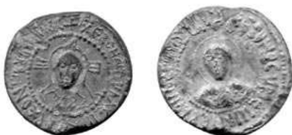
Обр. 3. Новооткрит печат на Симеон, архонт на България (893–897 ?) в Силистра