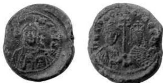
Обр. 5. Новооткрит печат на Петър, благочестив василевс (40–50-те години на X в. ?) от Силистра