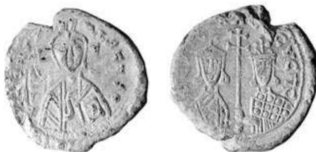
Обр. 7. Печат на цар Петър и царица Мария с инвокация Петър, Мария в Христа автократори на българите сечен след 932 г. открит в Преслав (тип 3Аб. по Ив. Йорданов)