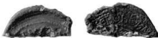
Обр. 2. Печат на княз Борис I Михаил от Силистра