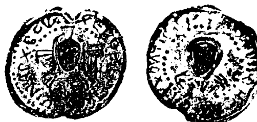
Обр. 4. Печат на Симеон, архонт на България (893–897 ?) от Силистра в колекцията на А. Папахаджи