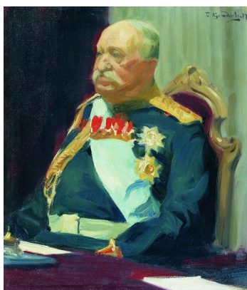
Граф Н. П. Игнатиев (1832 – 1908)

Този подем на националното осъзнаване на българите и борбата с либерални средства за национална самостоятелност в рамките на Османската империя са особено силни. Силни позиции има и идеята за създаване на дуалистична империя и султанът да се короняса за български цар. Сред носителите на тази идея е Г. С. Раковски. По-късно Раковски приема радикализма и се премества в Букурещ.