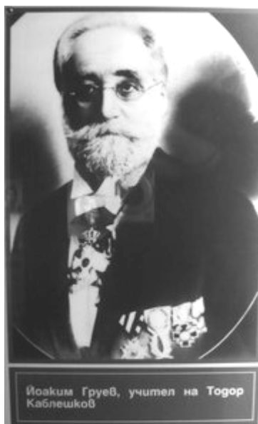
Йоаким Груев (1828 – 1911)

В Османската империя много българи чрез образованието излизат от своята семейна среда и заемат достойно място в обществото. Благодарение на българското си самосъзнание те се отърсват от гръцкото влияние и преживяват духовно прераждане. Такива са Васил Априлов, д-р Иван Селимивски, Неофит Рилски, д-р Иван Богоров, Константин Фотинов и др. Техният живот и дейност показват българите като самостоятелна нация, различна от гърците. От тези хора започва развитието на българската национална идея. Те са първите кълнове, от които тръгва и се разраства буйната гора на национализма и след това на България.