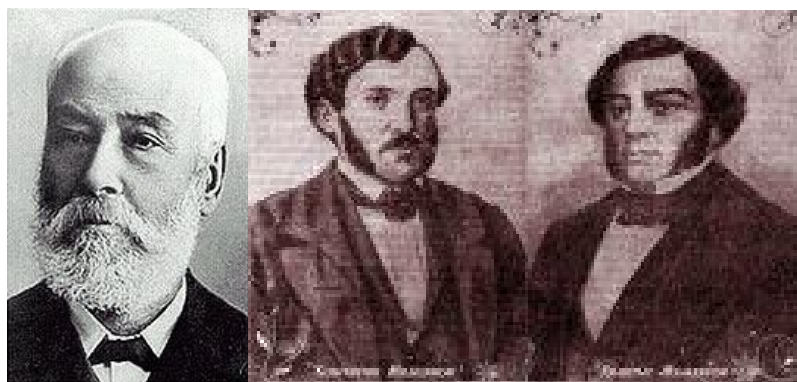
Найден Геров (1823 - 1900), Братя Константин и Димитър Миладинови

Литературните творци съществено развиват езика. В употреба се въвеждат много нови думи, които усъвършенстват и обогатяват езика. 20