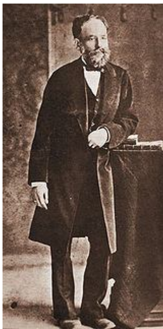
Издателят Христо Г. Данов

Развитието на икономиката и културата увеличава и засилва връзките между отделните български области. На големите панаири в Узунджово и Ески Джумая (Търговище) се срещат занаятчии и търговци от всички краища на България. След 1855 г. там е и Христо Г. Данов (1828-1911), първият български книгоиздател 8 . Той заедно със съдружника си Драган Манчов развива много издателството си в Пловдив и създава клонове (представителства) във Велес, Русе, Битоля и на други места. След него тръгват и други български издатели. Така България в навечерието на Войните за национално обединение е страна с високо развита култура и силна издателска дейност.