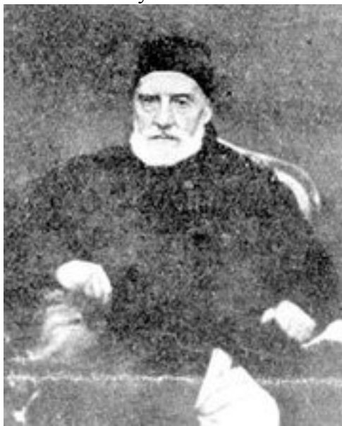
Княз Стефан Богориди (1775, Котел – 01.08.1859, Цариград)