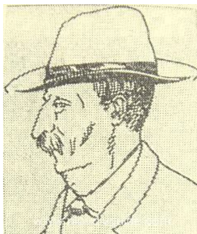
д-р Иван Богоров (1818 - 1892)

Развитието на културата в българските земи е продължение на народното творчество. Братя Миладинови издават своя сборник “Български народни песни” (1861). Активно работят в тази област Найден Геров и Петко Славейков. Н. Геров подготвя и издава своя “Речник на българския език с тълкувание речити на български и руски” (5 ч. 1895 – 1904), в който са включени над 70000 думи и над 10000 изрази, пословици и др. 19 Н. Геров активно участва в полемиката за българския език и утвърждаването на езиковите норми. Петко Славейков събира български пословици, поговорки и изрази.