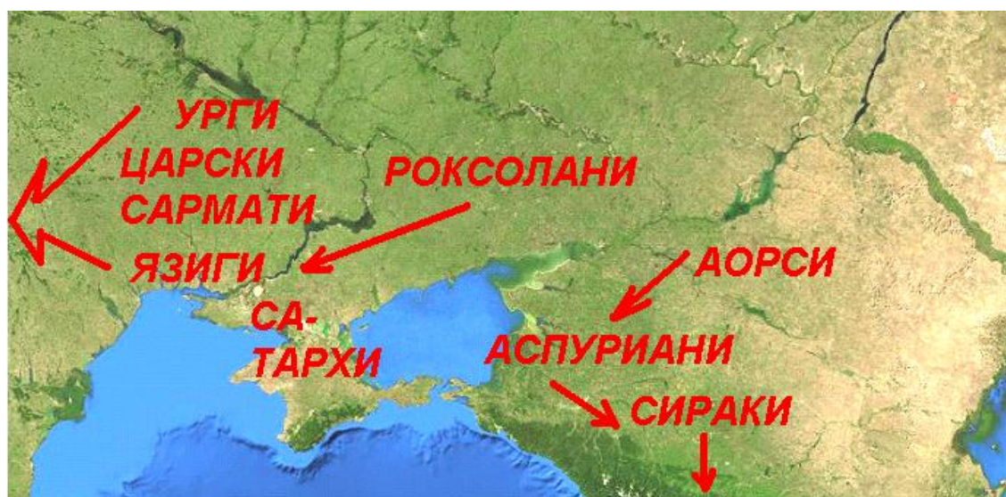
Фиг 2. В средата на II в. пр.н.е.

компютърен превод от англ.: Ж.Войников 13.03.2012 г.