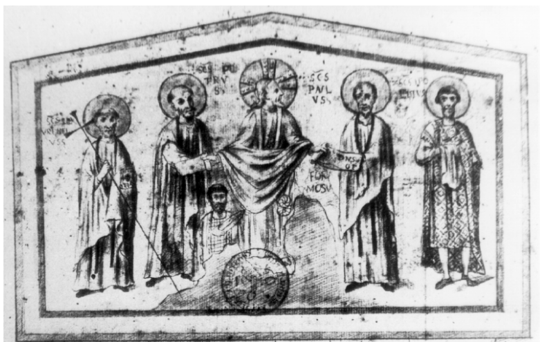
Обр. 2. Фреската от Монте Челио в Рим - факсимиле от рисунката на Чиампини.