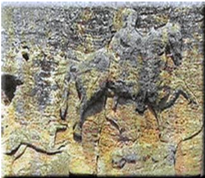
Мадарският конник VIII век.

Мадарският конник е барелеф изсечен по времето на Първото българско царство. Този паметник на ранното българско наследство е свързан с владетеля Тервел. В надписите под него се говори освен за Тервел и за владетелите Крум, Омуртаг, император Юстиниан II. Последователите на Ценов изтъкват очевидното сходство в инокогафията на Мадарския конник с тракийските образци. Те смятат, че независимо от това кой е създателя на конника, какво е било влаганото в него значение, както и какви точно са били образците и моделите, използвани от майстора за неговата направа, този уникален за цялата територия на Европа паметник е пример за приемственост.