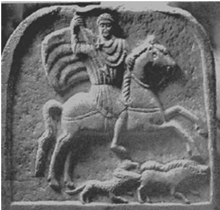
Оброчна плоча на тракийски конник III век, намерена в светилището на село Езерово, Пловдивска област.

Някои от поддръжниците на Ценов и идеите му правят съпоставка между Мадарския конник и образа на т.нар. Тракийски Херос.