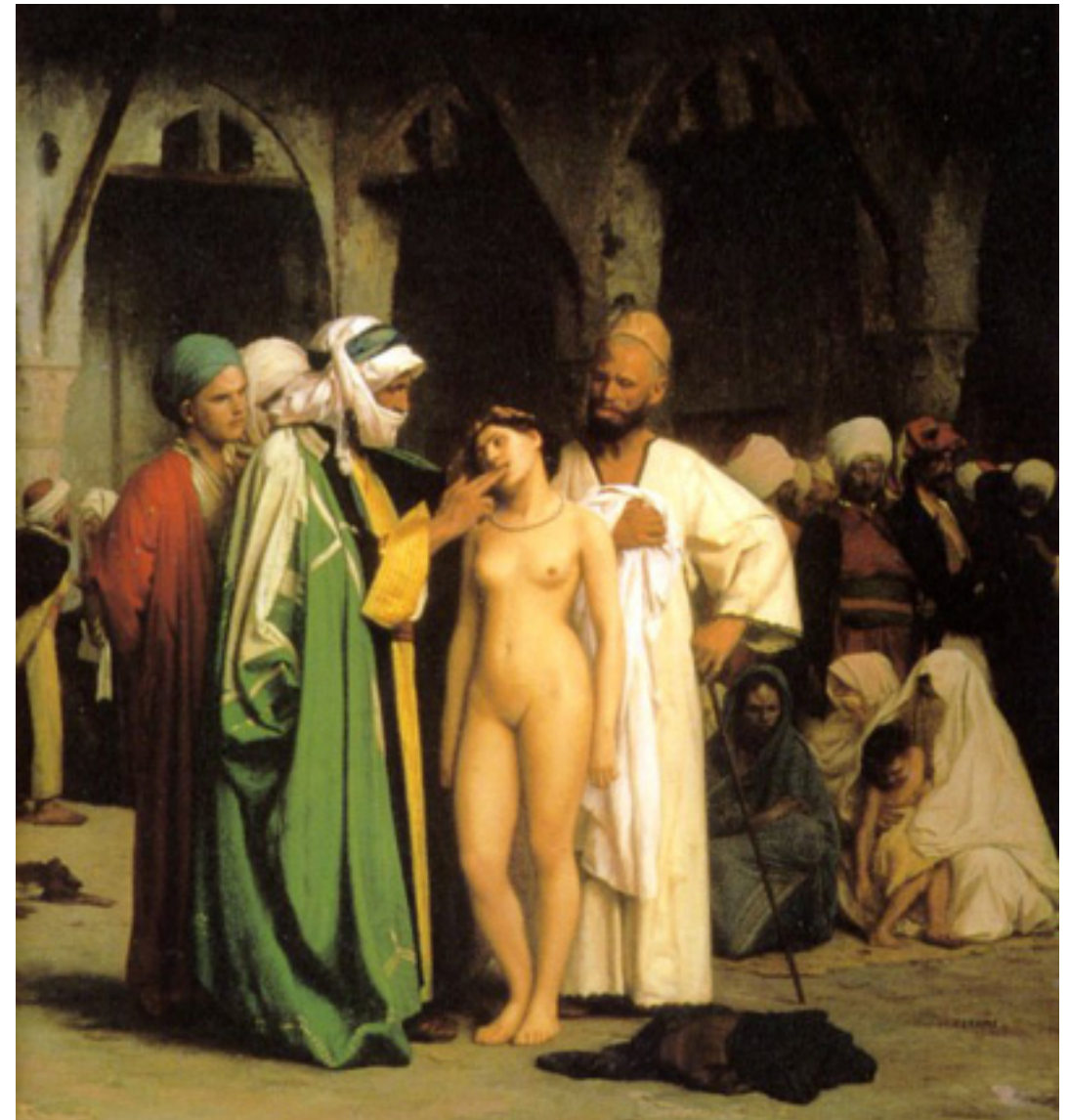
Пазар на роби. Картина от втората половина на XIX в.

14 Aristarchi bey, Gr. Op. cit., 35-38; Дулина, Н., Танзимат и Мустафа Решид-паша . М., 1984, 130-131.