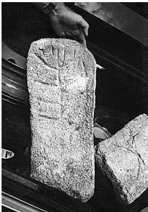
Надгробная плита, найденная на окраине античного города Кепы (Таманский п-ов).

На Северном Кавказе, вопреки известиям «Кембриджского документа», рассказывающего о жизни евреев — беженцев из Закавказья (Тогармы) среди хазар, собственно иудейские древности как хазарского, так и дохазарского времени не обнаружены 9 . Известный оптимизм для будущих исследований, помимо находок на городище Шамран, внушают находки в столице ранне-средневековой Грузии Мцхета, где обнаружены остатки иудейского квартала (см. о находке там арамейского амулета — азбучной молитвы 10 ). Что касается отдельных находок в Северокавказском регионе, прежде всего фрагментов