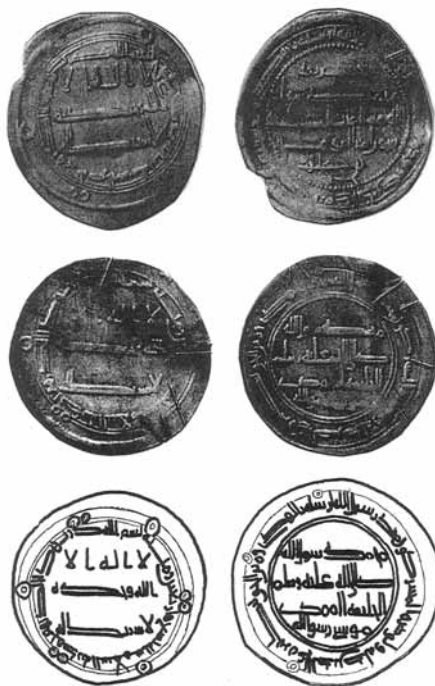
Дирхемы из клада Спиллингс 2 (о-в Готланд) с надписью на реверсе «Моисей — посланник Божий»

В целом по данным археологии большая часть населения Хазарии в VIII—X вв. следовала традиционным языческим культам с различающимися